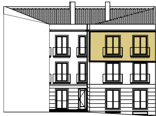
S/ Escala - Alçado Principal